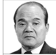
福知山市 家元 丈夫