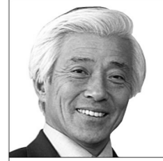
相楽郡 伝宝 和平