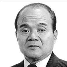
福知山市 家元 丈夫