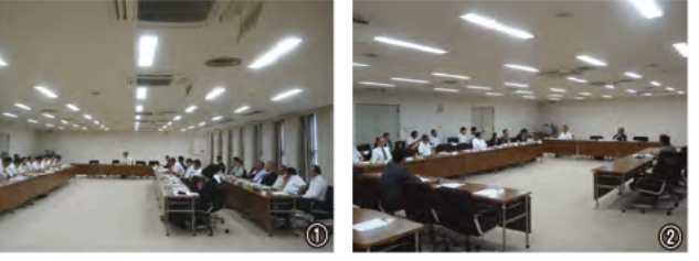
①政策・行財政部会