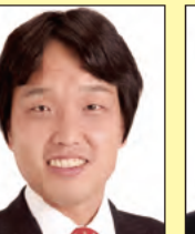
右京区 ニノ湯しんじ