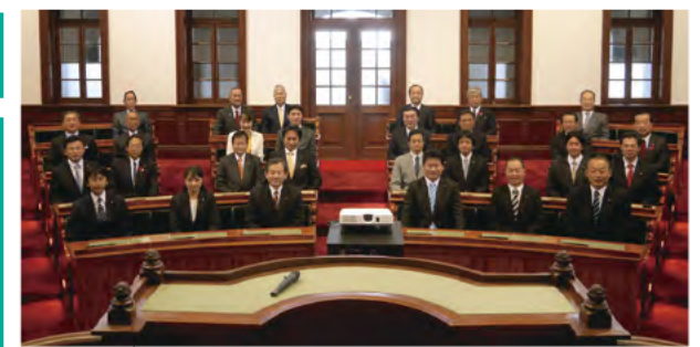
府庁旧本館内にある旧議場を明治当初の姿へと修復整備する第1期工事竣工を受け、文化財の修復整備状況について調査

筑波大学藻類バイオマス・エネルギーシステム研究拠点にてボトリオコッカス(淡水に生息する光合成藻類)の培養装置等について説明を聴取。陸生油脂植物の数十から数百倍のオイル生産能力を有する藻類は新たなバイオマスとして注目を集めている